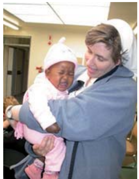
Weltweit werden knapp 27% aller von Aids betroffenen Menschen von Hilfsorganisationen der katholischen Kirche, wie der Caritas betreut.