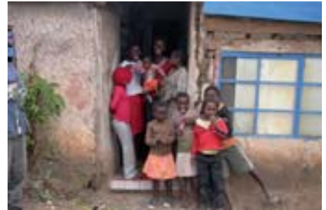
Die Hauptursachen von HIV/Aids sind Armut, Mangel an Bildung und Information sowie Geschlechterdiskriminierung.