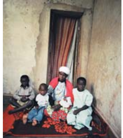
Vor allem auf dem Land fehlen häufig die nötigen Strukturen für eine medizinische Versorgung.

Aids zieht in den Armenhäusern der Welt einen Teufelskreis nach sich. Armut vergrößert die HIV-Gefährdung und HIV/Aids vergrößert wiederum die Armut. Während sich die Armut ausbreitet, wird der Zugang zu Bildung, Arbeit und Gesundheitssystemen immer schwieriger: Die Pandemie macht die Entwicklung rückläufig.