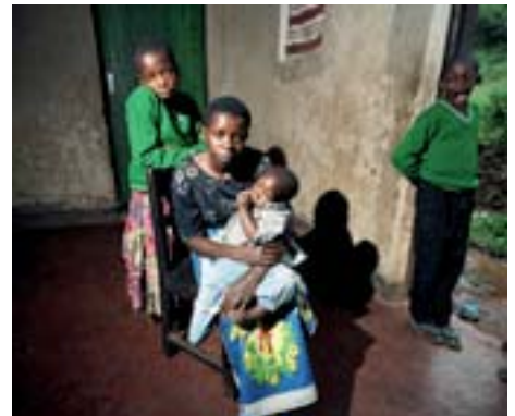
In Afrika südlich der Sahara ist Aids die häufigste Todesursache.

26,7 % aller weltweit von HIV/Aids betroffenen Menschen werden von der katholischen Kirche und ihren Hilfsorganisationen, mit der Caritas als einer der wichtigsten TrägerInnen, betreut.