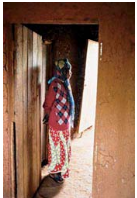
189 Regierungen haben sich dazu verpflichtet die Ausbreitung von HIV/Aids bis 2015 zum Stillstand zu bringen.