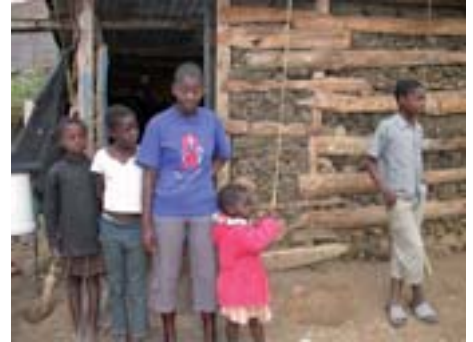
Aids hat häufig zur Folge, dass Kinder zu Hause ihre Angehörigen pflegen oder für das Einkommen sorgen müssen, anstatt zur Schule zu gehen.