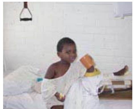
In den Entwicklungsländern sind die Behandlungsmöglichkeiten für HIV/Aids sehr eingeschränkt.

Zudem sind in den sogenannten Entwicklungsländern die Behandlungsmöglichkeiten äußerst eingeschränkt.