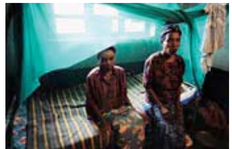
Armut vergrößert die Gefahr, mit HIV infiziert zu werden und HIV/Aids vergrößert wiederum die Armut: ein Teufelskreis entsetzt.