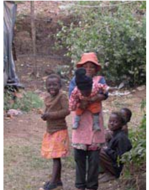
In den vielen „Kinderfamilien“ müssen die älteren Kinder die Rolle der Eltern übernehmen.

Auch bei der Verteilung von lebensverlängernden Medikamenten haben HIV-infizierte Frauen oft das Nachsehen und müssen – aufgrund ihrer gesellschaftlichen Unterordnung – länger auf diese Medikamenten-Therapie warten.